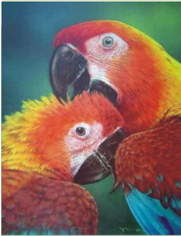
Especie Portada: Miradas del pasado, Guacamayo Cubano ( Ara tricolor ). Autor: Nils Navarro