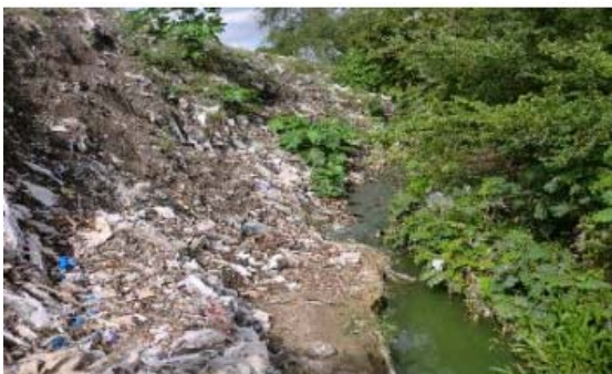
Figura 3. Contaminantes físicos que afectan al río Pontezuelo.