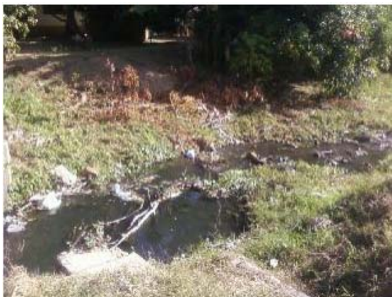
Figura 4. Contaminantes químicos que afectan al río Pontezuelo.