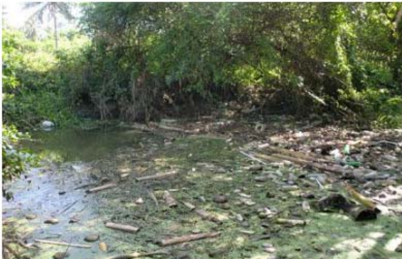
Figura 2. Contaminantes biológicos que afectan al río Pontezuelo.