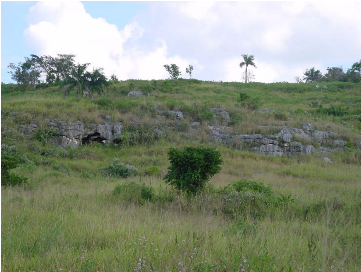
Antigua cantera en Loma Candela. Neoestratotipo de la Formación Güines

Corte de 10 m en la pared N de la antigua cantera La Coca, en Loma Candela, aproximadamente a 700 m al N-NW del apeadero del ferrocarril de La Coca y a unos 7 km al NW del pueblo de Güines, provincia de La Habana. Establecido por J. F. de Albear (1985). Coordenadas Lambert: y - 388 530 x - 338 900, Hoja San José de las Lajas, 3784 I.