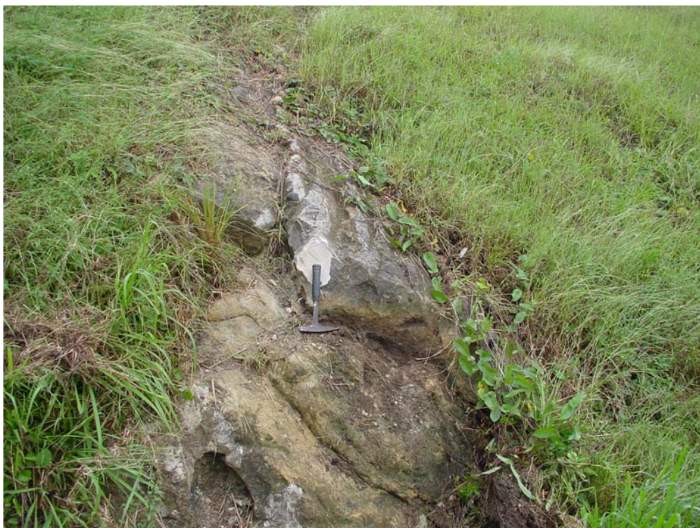
Localidad tipo de la Formación Guanajay

Este es un geosítio consistente en un corte bajo, semidestruido, fuertemente enyerbado, de hecho casi inexistente, en el talud de la carretera Guanajay-Mariel, en un lugar que Bermúdez denominaba Loma Jabaco, pero cuyo relieve no se adapta a las características del lugar y que para la memoria ha desaparecido con el tiempo.