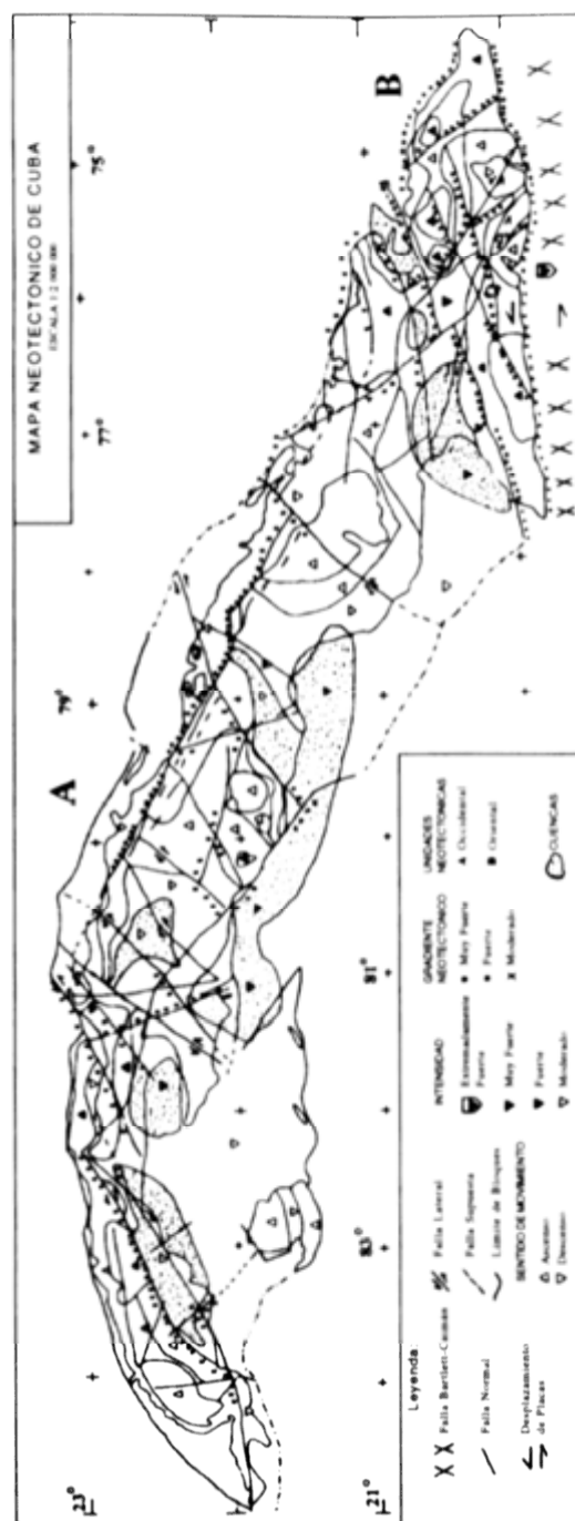
Figura 1. Esquema simplificado del mapa neotectónico de Cuba, escala 1:1.000.000.

A continuación una breve descripción de sus características generales: